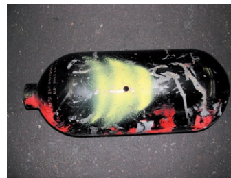
Sachgemässe Anlieferung Flüssiggas-Tank/Gasflasche: Beispiel demontierter Gasflasche mit Lochung