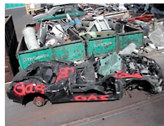
Sachgemässe Anlieferung Fahrzeug: LPG-Fahrzeug mit Kennzeichnung «Gas»